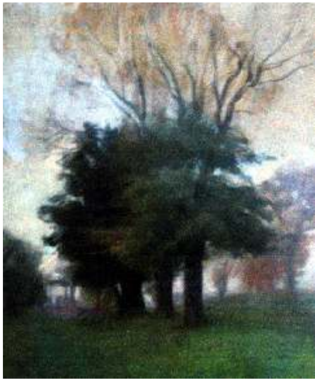
Alessandro Poma, "Tempietto di Diana visto dal bosco" (1904) Pastello su carta

Spesse volte il Poma, autore altresì di opere ispirate alle Valli di Lanzo, Ala di Stura, guarda in particolare al paesaggio urbano con la serie di vedute della