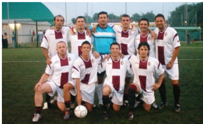
Quelli del Caffè Garibaldi