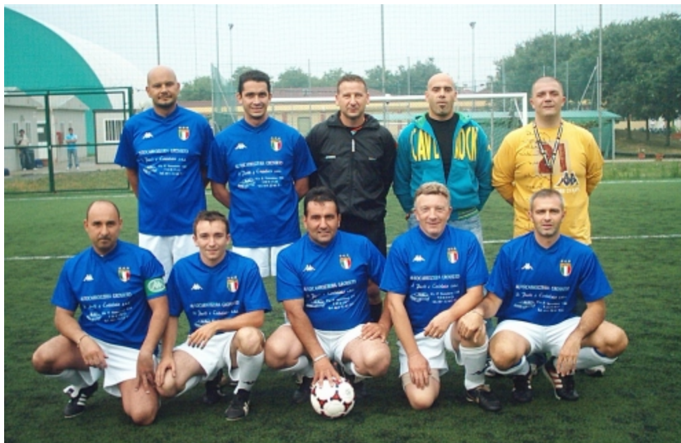
La formazione "Grosseto e Allocco"