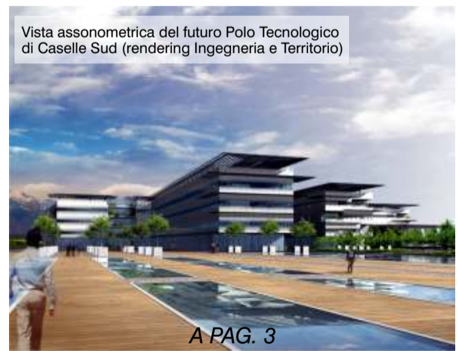
Vista assonometrica del futuro Polo Tecnologico di Caselle Sud (rendering Ingegneria e Territorio)

Il Sindaco della Città di Caselle Giuseppe Marsaglia Cagnola