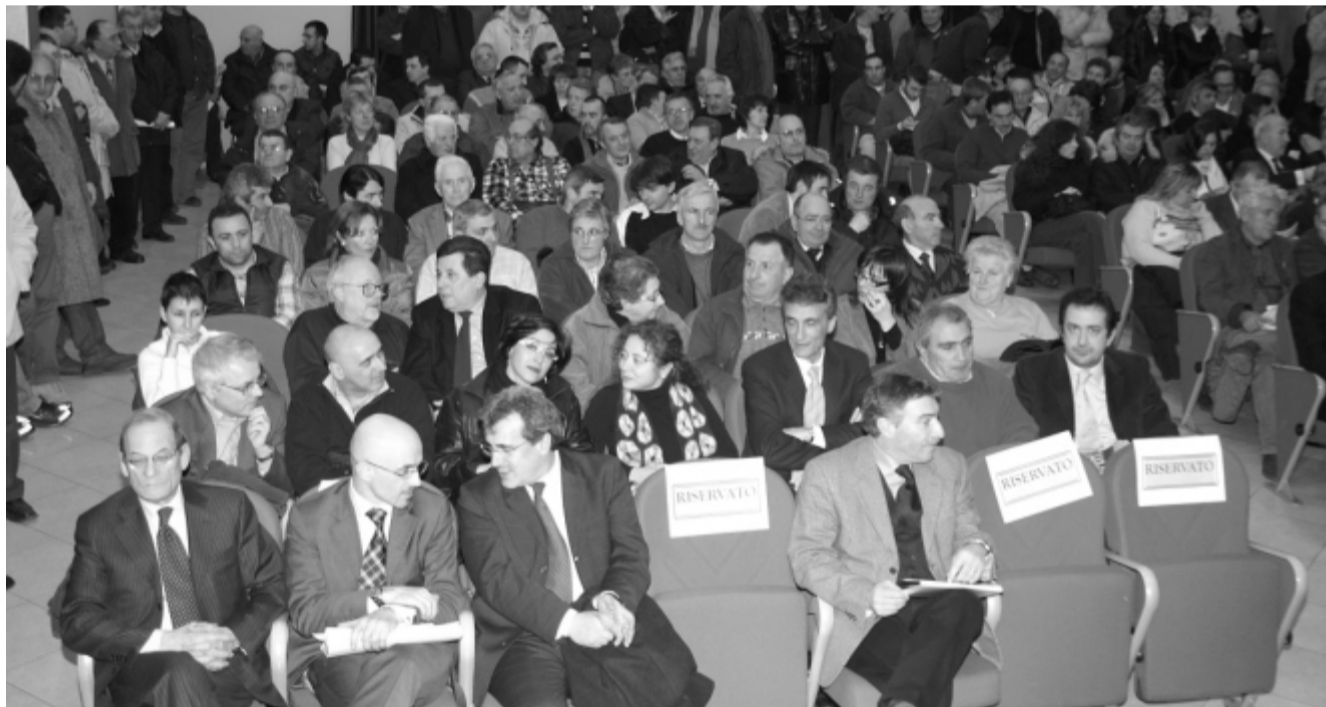
Una sala stracolma