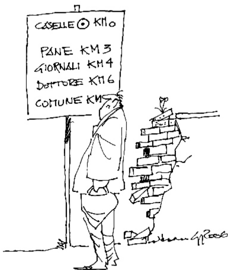
Disegno di Giulio Gianolio