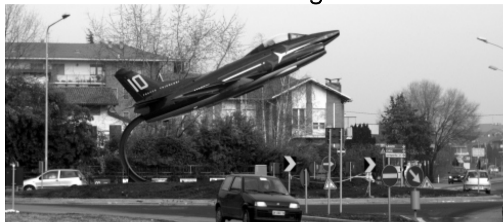
Fotoservizio a pagina 8